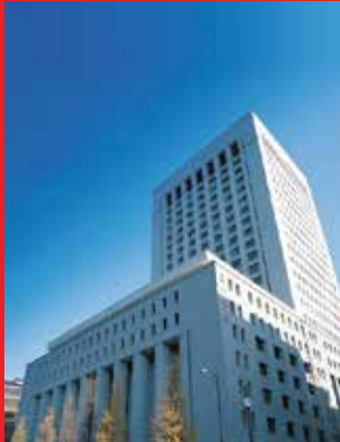
Tòa nhà trụ sở Dai-ichi Life Holdings tại Tokyo, Nhật Bản

(*) Vui lòng tham khảo Quy tắc và Điều khoản để biết thêm chi tiết về Điều khoản loại trừ.